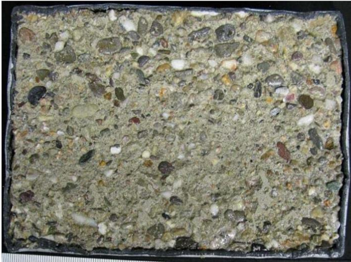
Abbildung 5: Oberfläche des Betons der Serie XF4 nach 56 Frost-Tau-Wechseln. Taumittel: 3 %ige NaCl-Lösung (Untersuchungsbericht Frost-Taumittel-Prüfung, Universität Duisburg-Essen, Institut für Materialwissenschaft, 2015)