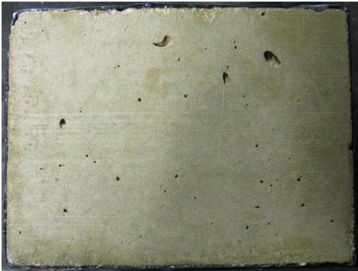
Abbildung 4: Oberfläche des Betons der Serie XD3 nach 28 Frost-Tau-Wechseln. Taumittel Ice & Dust-Away 25 (Originallösung) (Untersuchungsbericht Frost-Taumittel-Prüfung, Universität Duisburg-Essen, Institut für Materialwissenschaft, 2015)