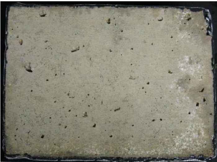
Abbildung 6: Oberfläche des Betons der Serie XF4 nach 56 Frost-Tau-Wechseln. Taumittel: Ice & Dust-Away Plus (Originallösung) (Untersuchungsbericht Frost-Taumittel-Prüfung, Universität Duisburg-Essen, Institut für Materialwissenschaft, 2015)