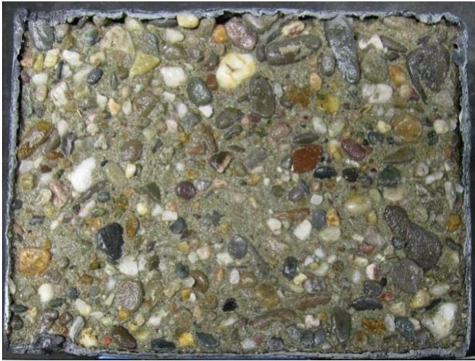
Abbildung 3: Oberfläche des Betons der Serie XD3 nach 28 Frost-Tau-Wechseln. Taumittel 3 %ige NaCl-Lösung. (Untersuchungsbericht Frost-Taumittel-Prüfung, Universität Duisburg-Essen, Institut für Materialwissenschaft, 2015)